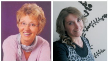
Das Team vom TOP-BODY Ernährungscenter, Telefon 0911-64119169

Deshalb sei es wichtig zu wissen, was mit Genuss gegessen werden darf und wie das Gewicht gehalten werden kann. Die Teilnahmegebühr inklusive aller Unterlagen beträgt 59 Euro. Demjenigen, der das meiste Gewicht bzw. den höchsten Fettanteil verloren hat, winkt ein Preisgeld. Die Gruppe startet ab dem 11. September 2013 – weitere Informationen unter Tel. 0911-64119169